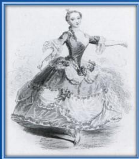
Первые платья балерин

Балет придумали в Италии – хотя таким, как сейчас, он стал во Франции. Сначала балет танцевали во дворцах в длинных платьях и использовали маски. Но в длинных платьях с кринолином, туфлях на каблуке и высоких париках было очень не удобно танцевать, поэтому позже танцовщицы укоротили свои юбки, теперь они носили пачки-шопенки – длинные пышные юбки из легкого тюля. Постепенно юбки стали все короче и жестче, и в конце концов появилась классическая пачка , торчащая в стороны. Совсем юные танцовщики, которые делают первые шаги и учатся овладевать движениями, занимаются в эластичных купальниках, они дают необходимую свободу движений. Под купальником носят белые колготки, которые плотно прилегают к ноге.