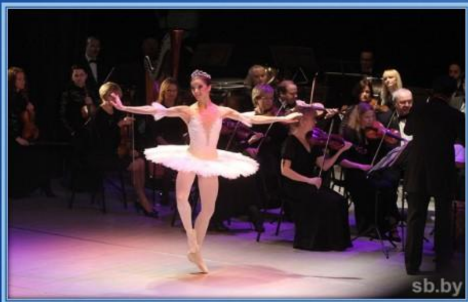
Балерина и симфонический оркестр

Над балетом работает целый коллектив: композитор – пишет музыку, сценарист – пишет либретто (Либрétто — литературная основа большого вокального (и не только) сочинения, например, оперы, балета, оперетты; краткое содержание сюжета спектакля). Музыка неотъемлемая часть балета, которую исполняет симфонический оркестр. А руководит им дирижер.