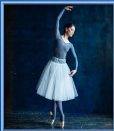
Пачка - шопенка