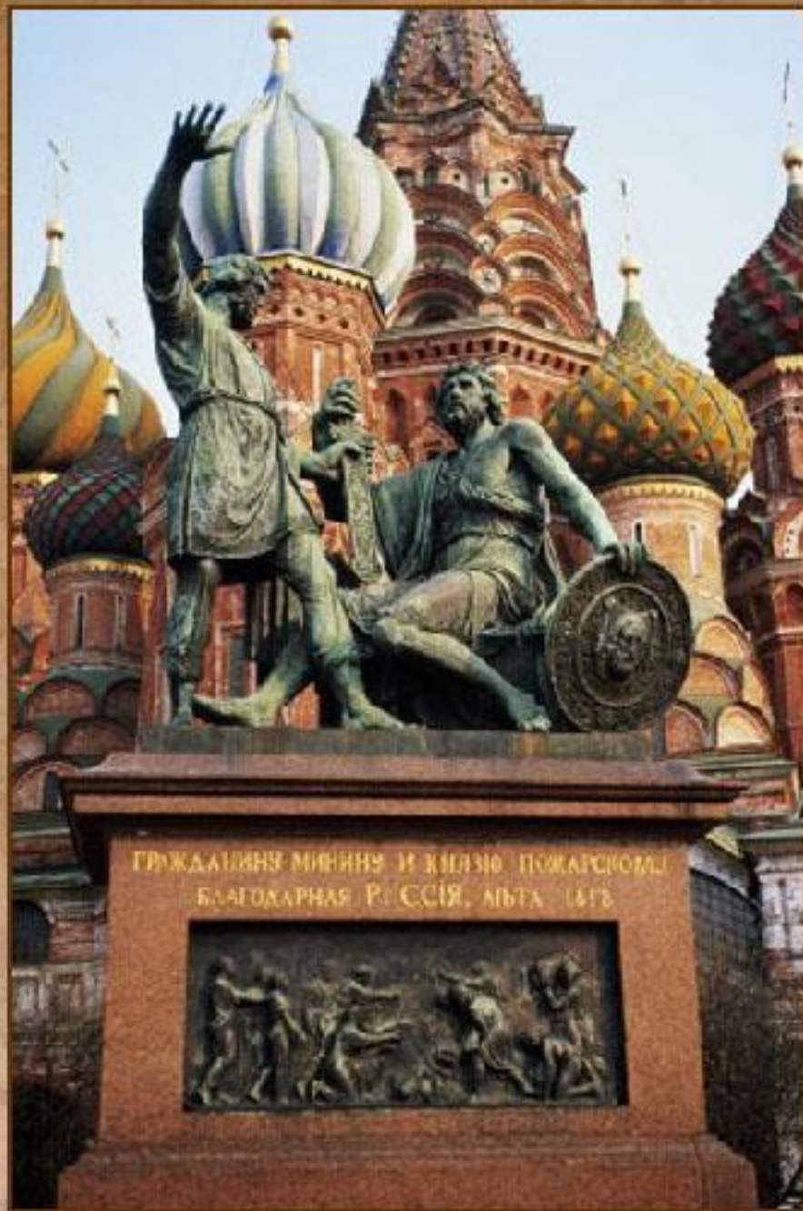
Памятник Минину и Пожарскому