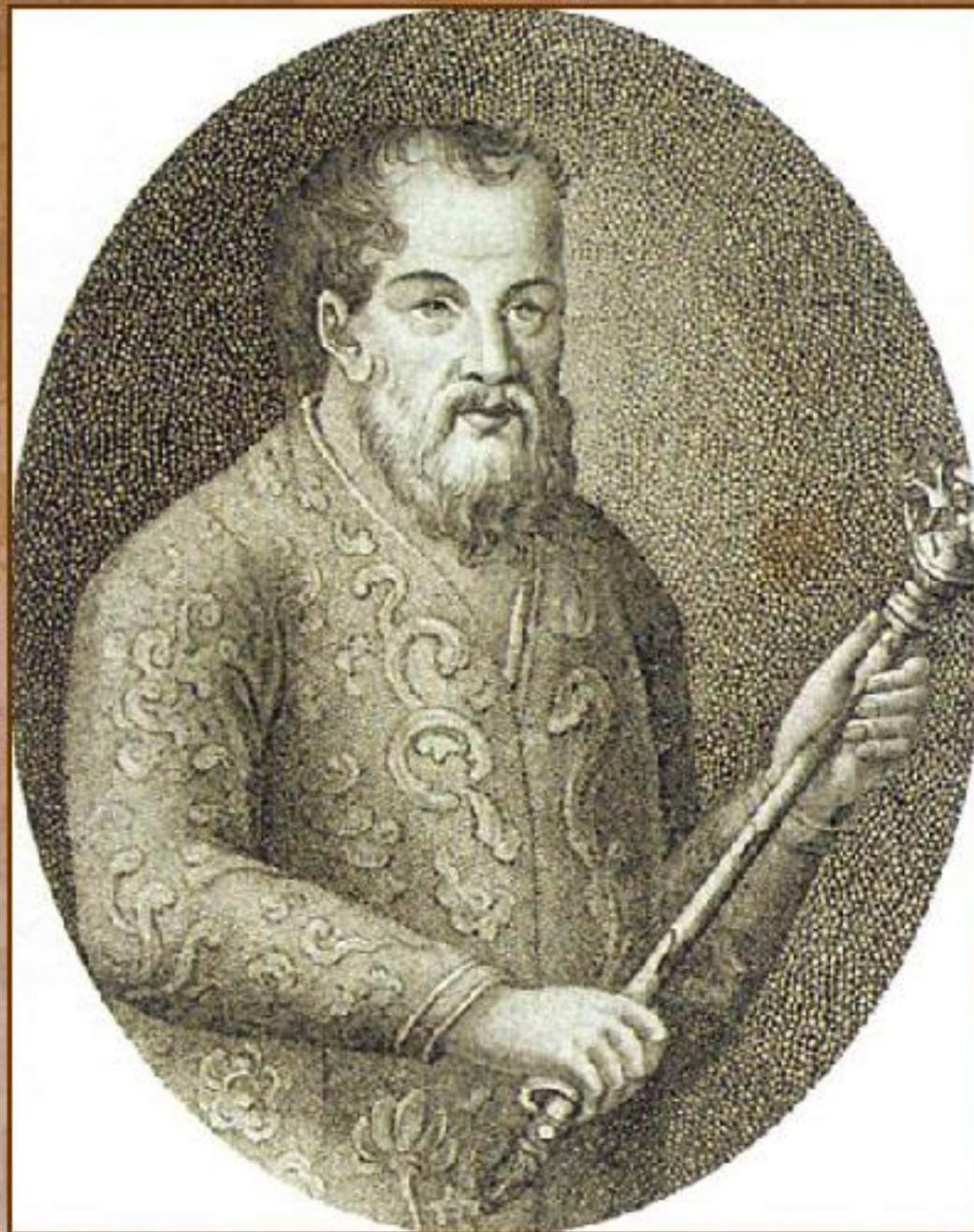
Пожарский Д.М., князь, глава Ямского приказа